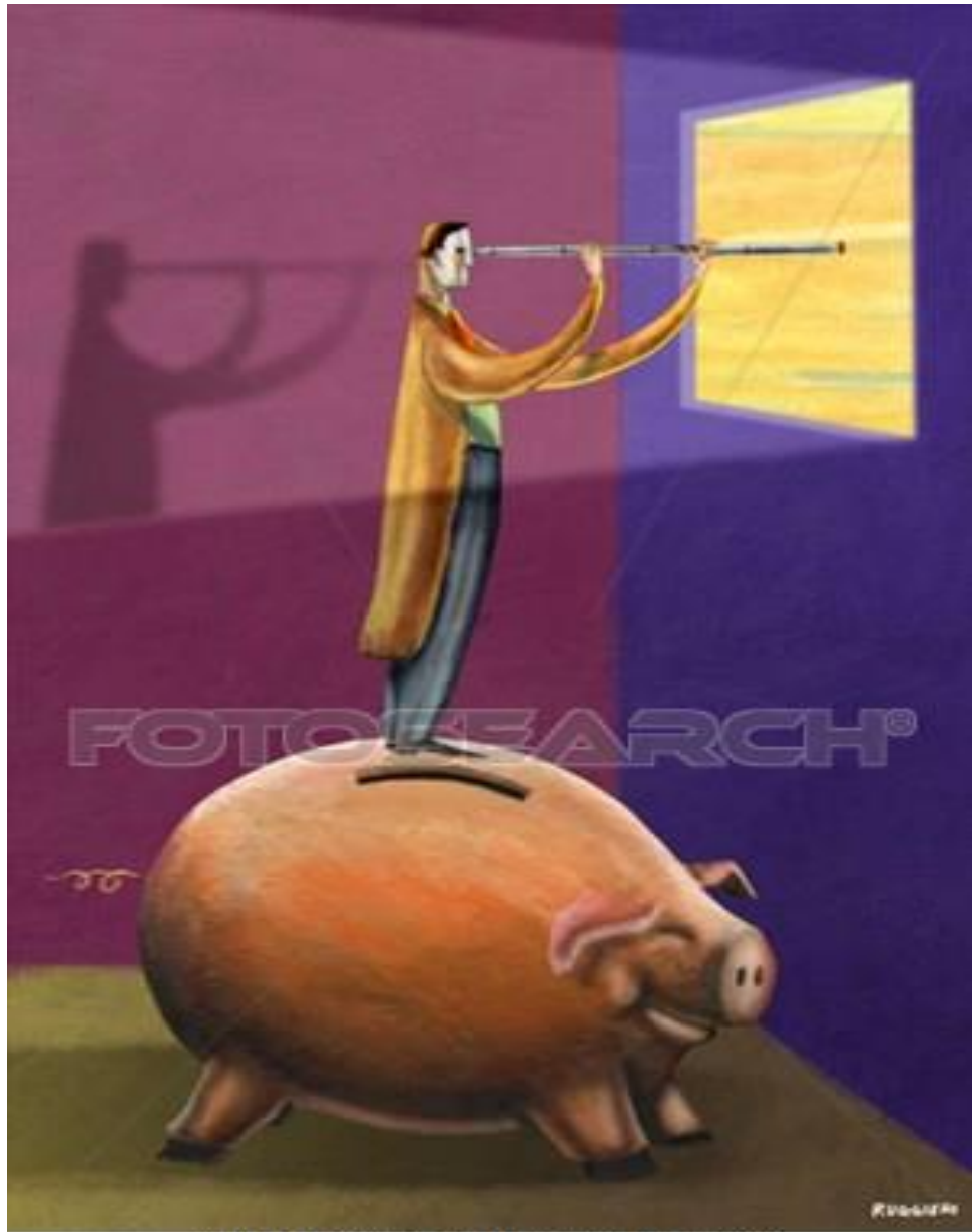
ruggia0344c fotosearch.com ©